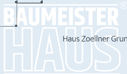
Haus Zoellner Grundriss