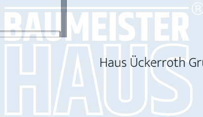
Haus Ückerroth Grundriss