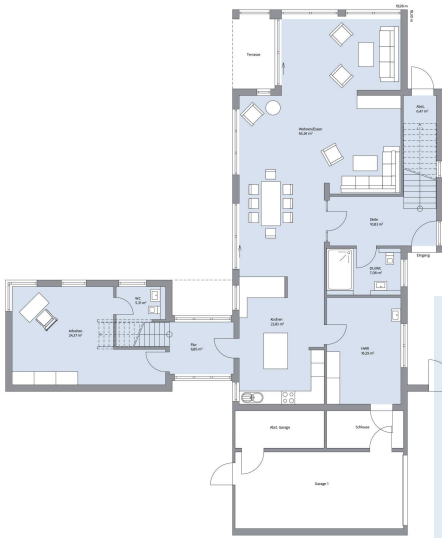
Haus Hofmeister Grundriss