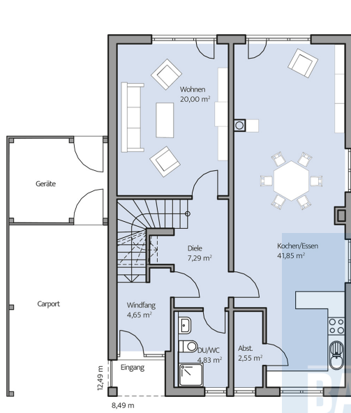
Haus Eichner Grundriss